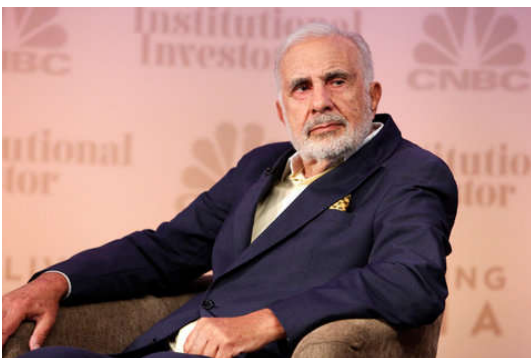
คาร์ล ไอคาห์น (Carl C. Icahn)

รายงานฉบับนี้จัดทำขึ้นโดยข้อมูลเท่าที่ปรากฏและเชื่อว่าเป็นที่น่าเชื่อถือได้แต่ไม่ถือเป็นภาระยืนยันหรือความถูกต้องและความสมบูรณ์ของข้อมูลนั้นๆ โดยบริษัทหลักทรัพย์ ยูเอบี เคย์ เอเชียน (ประเทศไทย) จำกัด (มหาชน) ผู้จัดทำขอสงวนสิทธิ์ในการเปลี่ยนแปลงความเห็นหรือประมาณการดังกล่าวที่ปรากฏในรายงานฉบับนี้ โดยไม่ต้องแจ้งล่วงหน้า รายงานฉบับนี้มีวัตถุประสงค์เพื่อใช้ประกอบการตัดสินใจของนักลงทุน โดยไม่ได้เป็นการชี้นำหรือชักชวนให้นักลงทุนทำการซื้อหรือขายหลักทรัพย์ หรือตราสารทางการเงินใดๆ ที่ปรากฏในรายงาน